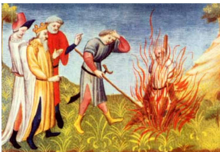
Rogo di un eretico (miniatura del XV secolo).

Italia, Germania e Spagna. La chiesa Catara di Concorezzo fu la prima comunità italiana di tale movimento e rimase per lungo tempo una delle chiese di riferimento.