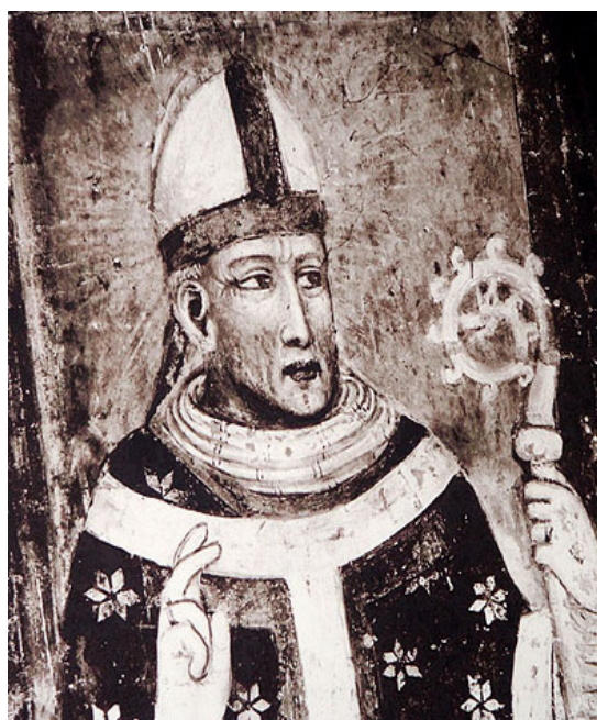
Il Beato Rainaldo Da Concorezzo

grandi capacità di mediatore dimostrate nel gestire le dispute tra la chiesa e i vari signori e il coinvolgimento nel processo ai cavalieri Templari, con la partecipazione al concilio di Vienne (Francia) voluto dal papa Clemente V. Nella vicenda dei Templari Rainaldo si dimostrò uomo giusto e coraggioso, pur subendo grandi pressioni da parte dei potenti del tempo che spingevano per un verdetto di condanna indiscriminata di tutti i cavalieri Templari.